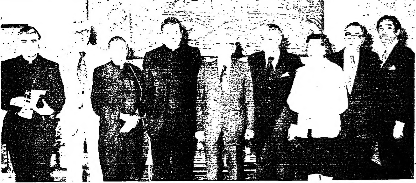
الرئيس فرنجية يتوسط الوفد الصحفي الاميركي الكاثوليك

وقال: الوقت ليس وقت مفاصلة دينية او طائفية، ولا جوارح مشحونة بسبب تصرفات بعض الفئات، واتصل حديثا ربا انت اقبال واسع، وتفتح البلاد منه غالبا.